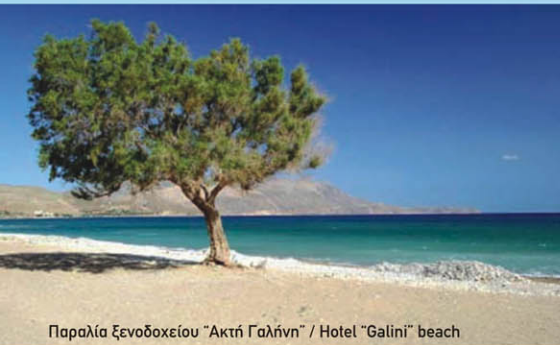
Παραλία Ξενοδοχείου "Ακτή Γαλήνη" / Hotel "Galini" beach

Galini Beach Hotel is a family hotel and its people are known for their hospitality and care to their visitors. The hotel is located just by a clean and calm beach, in which you may enjoy the beautiful Kissamos gulf sunset. Galini Beach is positioned at a peaceful place while only a 5-minute walk away you'll find plenty of shops, restaurants and cafes to enjoy your time. In reach of some kilometres are located some of the most beautiful beaches of Crete and Greece such as Falasarna, Balos lagoon and Elafonisi. The hotel is highly reviewed by Michael Muller verlag Crete and at The Rough Guide to Crete, two guides highly standing in Germany and UK.