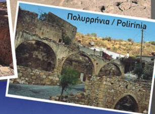
Πολυρρήνια / Polirrhinia