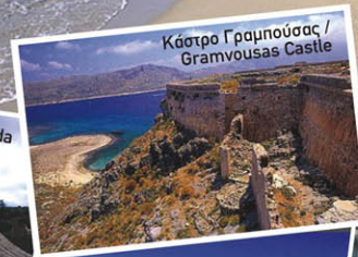
Κάστρο Γραμπούσας / Gramvousas Castle