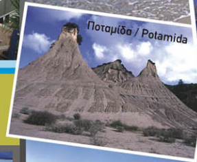
Ποταμίδα / Potamida