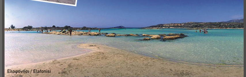
Ελαφονήσι / Elafonisi